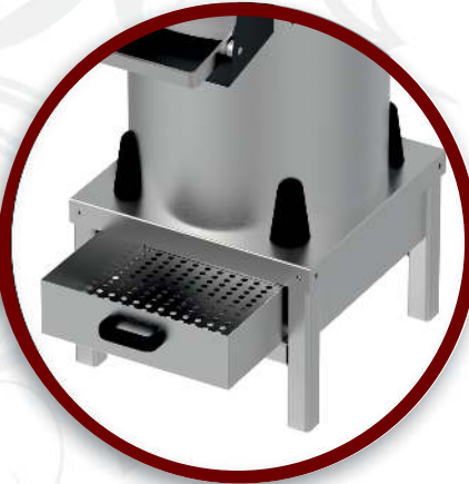
Filtre | Filter