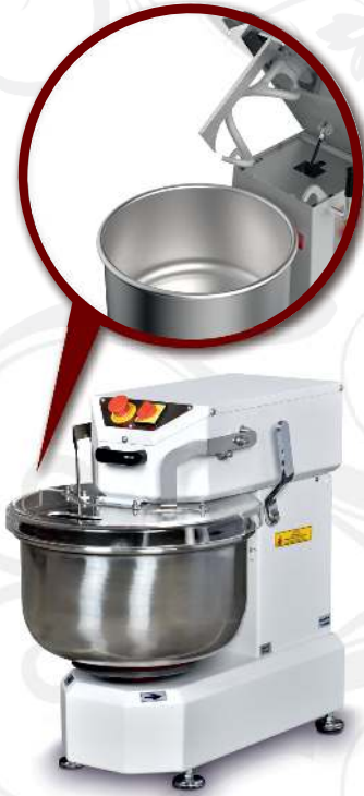
BSH.20 Kalkar Kafa