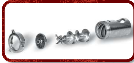
Removable Head Unit